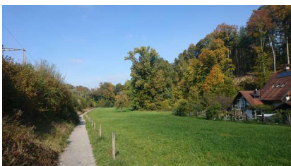
5 Minuten „Umweg“, die sich lohnen

Bald lassen wir Merenschwand hinter uns. Nach einem kurzen flachen Aufstieg befinden wir uns nach 30 Minuten schon wieder auf der anderen Seite des „Hügels“. Bei Benzenschwil lohnt sich ein kleiner Abstecher zum wunderschön angelegten Kinderweg .