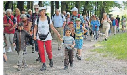
110 Leserwanderer waren auf der ersten Familienwanderung zwischen Wohlen und dem Erdmannistein dabei.