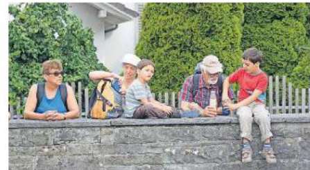
Rastpause mit den Grosseltern: Hungrig kam wohl auch am Mittwoch niemand nach Hause.