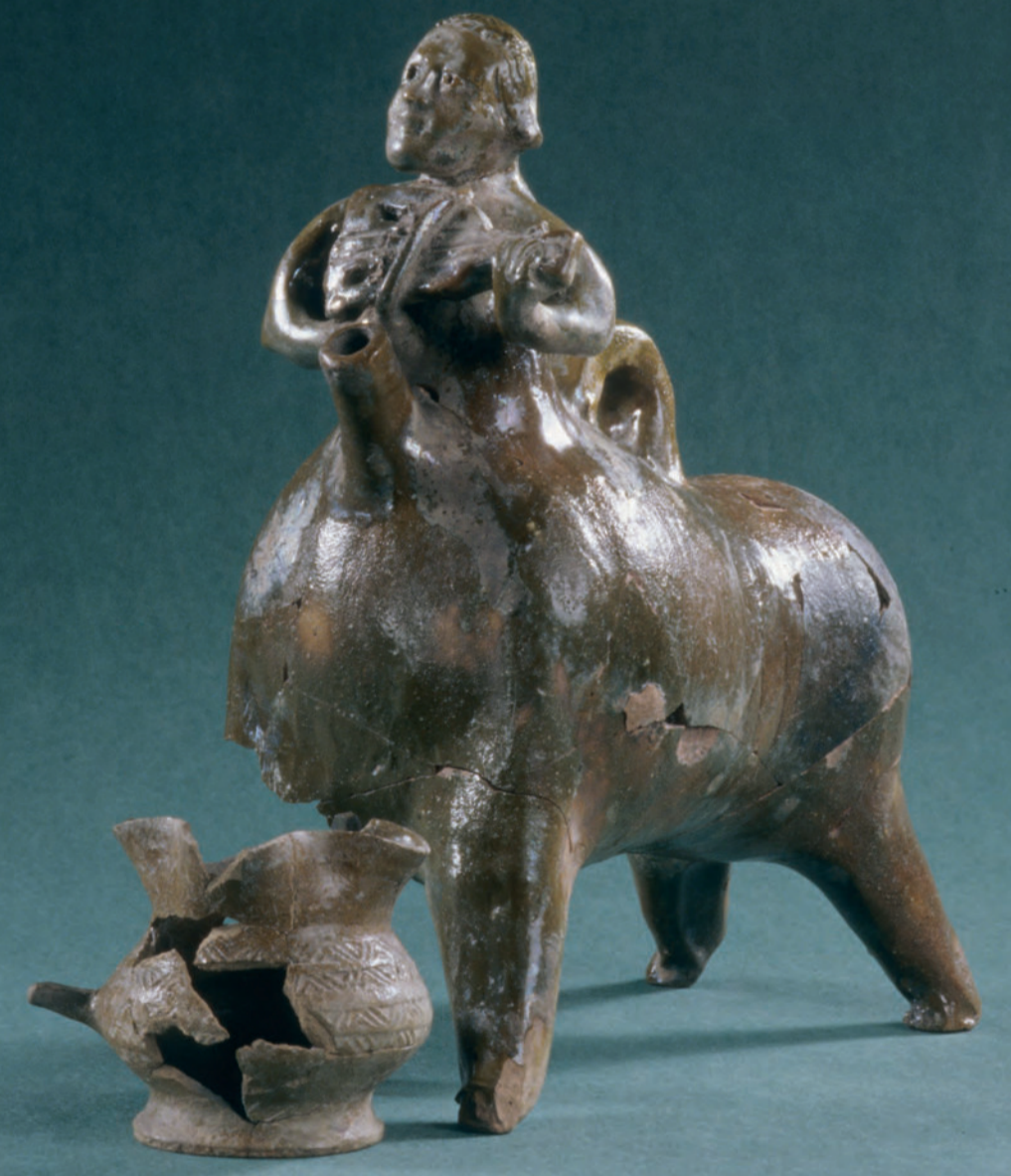
Giessgefäss in der Form eines die Fiedel spielenden Kentaur aus gelblich-grün glasierter Keramik sowie ein gelb glasierter Keramikbecher. Diese Funde aus dem Brandschutt von 1386 stehen beispielhaft für den Wohlstand der Bürger Meienbergs.

Einige Tage später zog ein österreichisches Heer gegen Meienberg und lockte die Besatzung vor die Stadt. Die Eidgenossen entkamen nur mit grossen Verlusten aus einem Hinterhalt. Sie hielten den Stadtbewohnern Verrat vor und zerstörten das Städtchen durch Feuer. Der Wiederaufbau der zerstörten Befestigungsanlagen wurde durch die Eidgenossen verwehrt und die Instandstellung der brandgeschädigten Häuser behindert. Dadurch verlor der Ort seine einstige Bedeutung und sank allmählich zum Weiler ab. Er behielt aber auch nach dem Übergang an die Eidgenossen 1415 das Marktrecht und blieb weiterhin der Mittelpunkt des Amtes Meienberg. Bis heute noch erhaltene Zeugen, die auf die mittelalterliche Stadt hinweisen, sind das unter kantonalem Denkmalschutz stehende Amtshaus (mittelalterlicher Wohnturm und Palas), die Stadtgräben und Teile der Ringmauer.