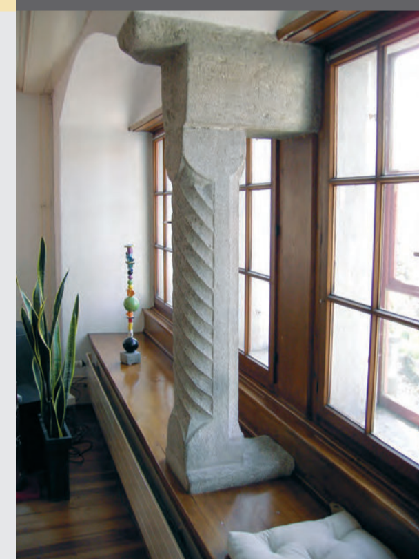
Exakt bearbeitete Säule als Tragkonstruktion in der Wohnstube im 1. Stock.