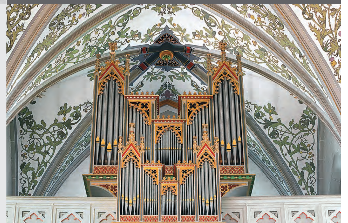
Orgelprospekt und Teile der reich verzierten Schiffsdecke.

Das weit herum sichtbare Wahrzeichen Villmergens birgt in der dreischiffigen Hallenkirche «den schönsten neugotischen Sakralraum des Kantons Aargau» (P. Felder). Sie ist eine der grössten Kirchen des Kantons. Der Turm misst vom Boden bis zum Kamm des Hahns 63,43 Meter. In der Glockenstube hängen 7 Glocken. Die älteste (1638) war schon im Turm der alten Kirche. Die grösste wiegt 4'450 Kilogramm.