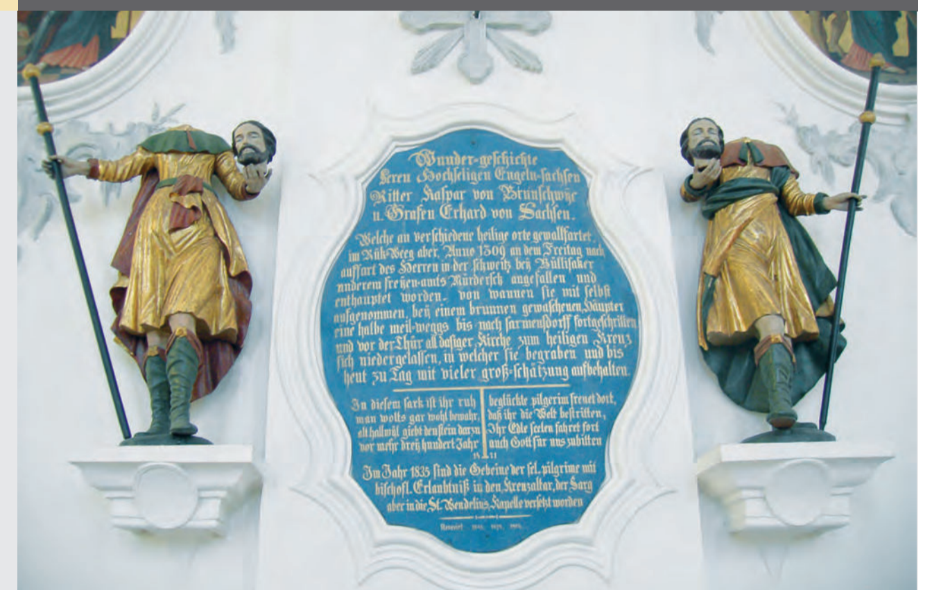
Epitaph (= Grabdenkmal, Grabinschrift) in der Pfarrkirche.

Es ist anzunehmen, dass die erste Kapelle mit der Angelsachsen-Legende entstanden ist. Die eigentliche, von Hans III. von Hallwyl 1311 gestiftete Angelsachsen-Kapelle stand aber über dem Grab der beiden Pilger im Schiff der Pfarrkirche. Die Reliquien erfuhren im Laufe der Zeit eine wechselvolle Geschichte. Sie wurden mehrmals