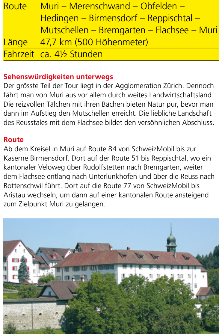
12 Kloster Hermetschwil C/D3