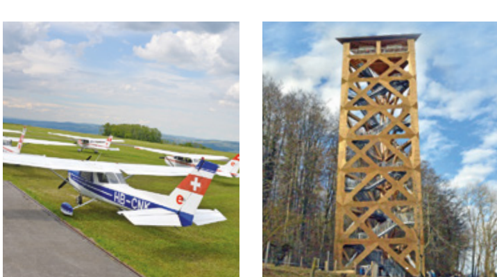
22 Flugplatz, Buttwil C5 28 Hasenbergturm, Widen D2/3