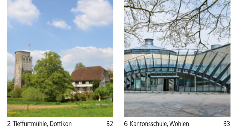
2 Tieferrmühle, Dottikon B2 6 Kantonschule, Wohlen B3