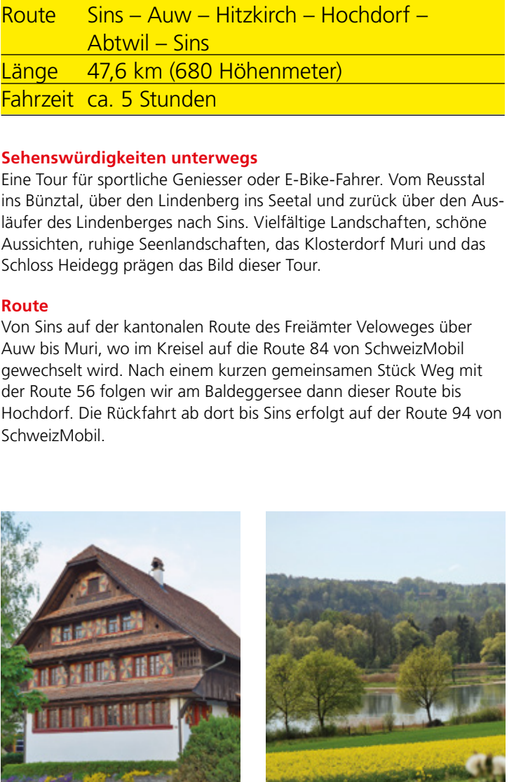
13 Kochhaus, Büttikon B4 14 Flachsee, Unterlunkhofen D4