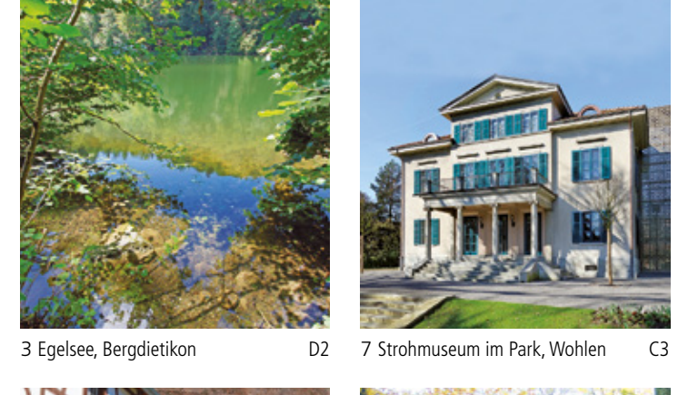
3 Egelsee, Bergdietikon D2 7 Strohmuseum im Park, Wohlen C3