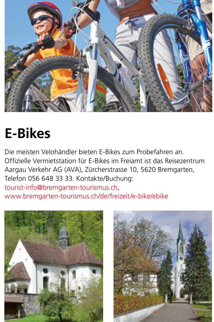
15 Wallfahrtskapelle Jonental E4 16 Zentrum mit Kirche, Bünzen C4