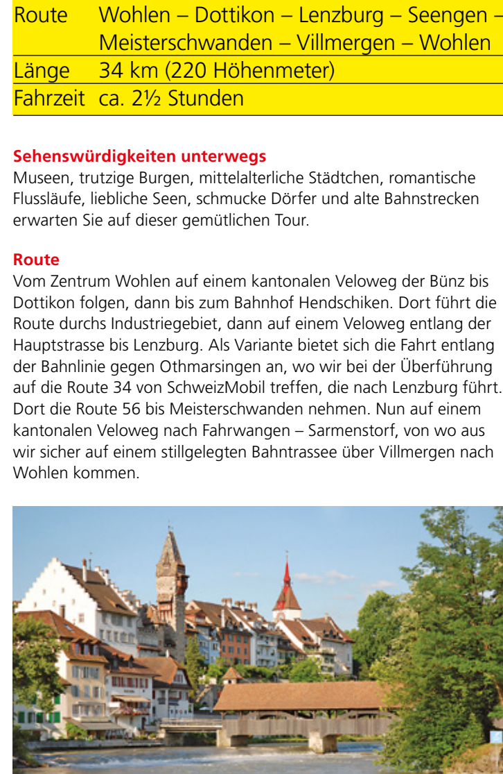
9 Altstadt, Bremgarten C3