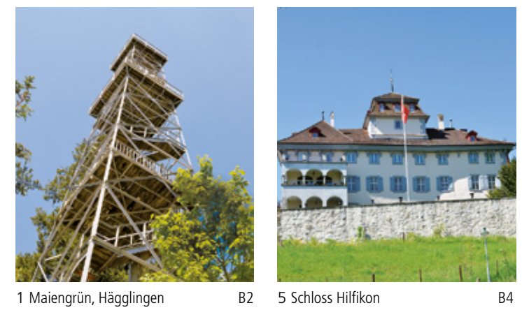
1 Maiengrün, Hägglingen B2 5 Schloss Hilfikon B4