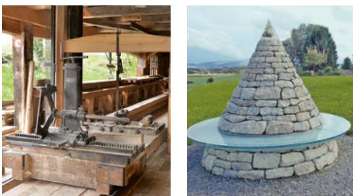
19 Historische Säge, Weissenbach C5 25 Besinnungsweg, Auw D6