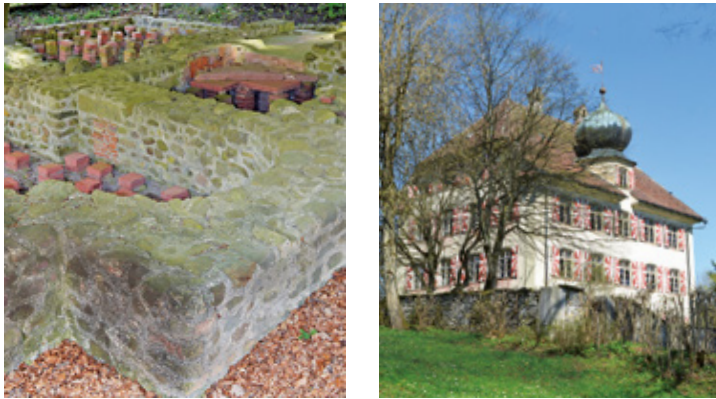
18 Römischer Gutshof, Sarmentorf B4 24 Schloss Horben C6