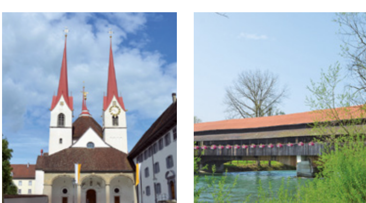
21 Benediktinerkloster, Muri C5 27 Reussbrücke, Sins D7