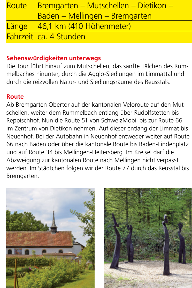
10 Einsiedelei Emaus, Zufikon D3 11 Sagenweg, Waltenschwil C3