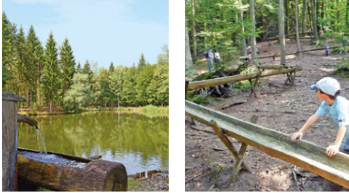
17 Feldenmoos, Boswil C4 23 Kinderweg, Benzenschwil D5