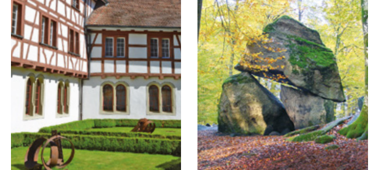
4 Klosterpark, Gnadenthal C2 8 Erdmannstein, Wohlen C3