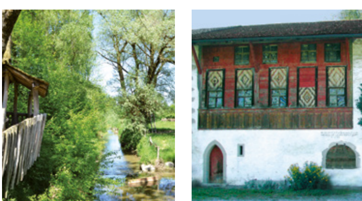
20 Spielplatz, Murimooos C4 26 Mittelalterliches Meisenberg, Sins D6