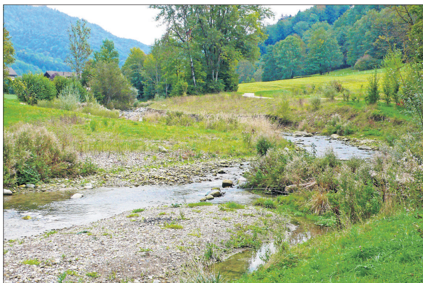
Fischbach bei Wettswil im Reppischtal.

Am Mittwoch, 17. Mai, organisiert Erlebnis Freiamt eine geführte Exkursion ab Bremgarten auf der Nordroute des Freiamter Veloweges. Die Strecke führt über Othmarsingen und Wohlen nach Bremgarten, inklusive Hinweisen zu Zielen und Problemen des öffentlichen Verkehrs dieser Region. Detailprogramm: www.freiamt.ch .